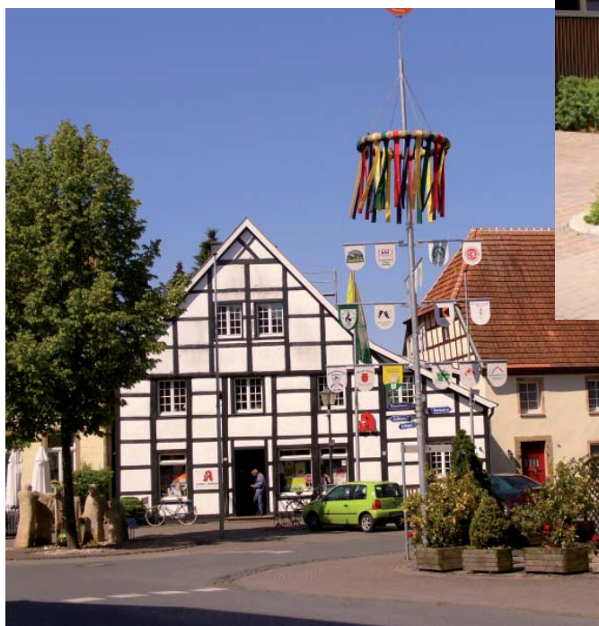
> Neu gestaltet - Zufahrt zum Sportgelände Brook - Verschönerung Tie in Füchtorf