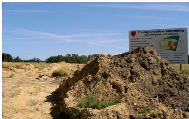
> Für Familien - ausreichend günstiges Bauland